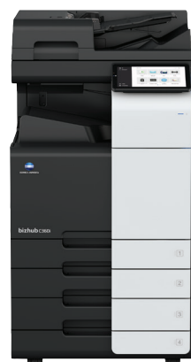
bizhub i-Series C360i