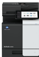
bizhub i-Series C4050i