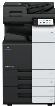
bizhub i-Series C360i