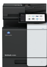
bizhub i-Series C4050i

Para obtener más información, visite workplacehub.konicaminolta.com