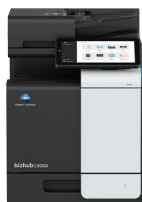
bizhub i-Series C4050i