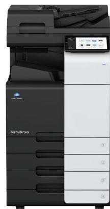
bizhub i-Series C360i