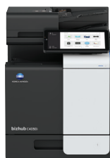
bizhub i-Series C4050i

Para obtener más información, visite workplacehub.konicaminolta.com