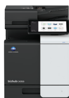
bizhub i-Series C4050i