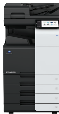
bizhub i-Series C360i