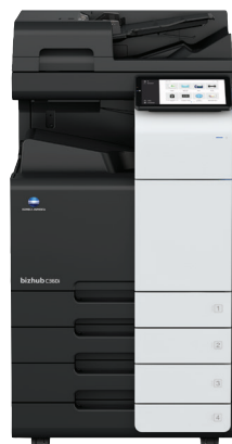
bizhub i-Series C360i